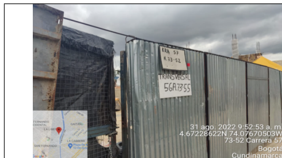
Fotografía 1. Nomenclatura del predio infractor en el sitio.

Como evidencia de la visita realizada al predio ubicado en la Transversal 56A No. 73 - 55 de la Localidad de Barrios Unidos, se presenta el siguiente registro fotográfico representando en el mismo lo evidenciado en el predio: