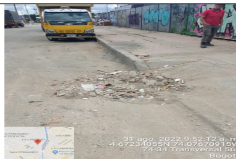
Fotografía 2. Espacio público sobre carrera 57 con presencia de RCD.